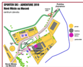
Mapka centra závodu